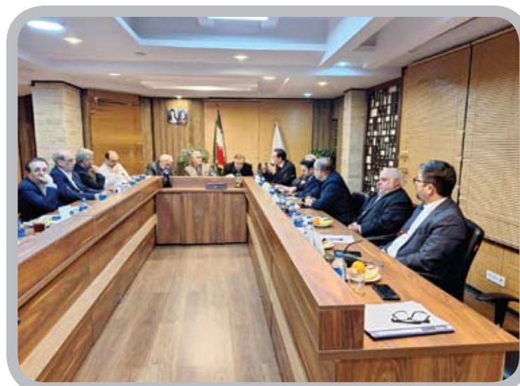
با اشاره به اینکه دولت اکنون ۲۰۰۰ همت کسری بودجه دارد گفت: وقتی دولت برای انجام امور جاری